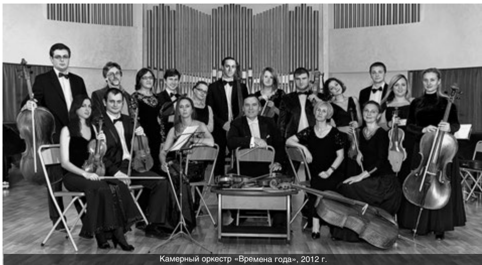
Камерный оркестр «Времена года», 2012 г.