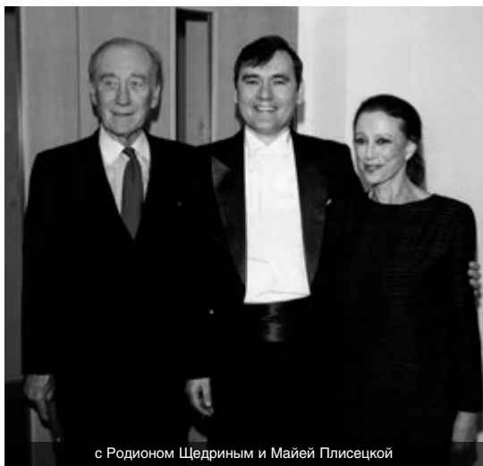
с Родионом Щедриным и Майей Плисецкой