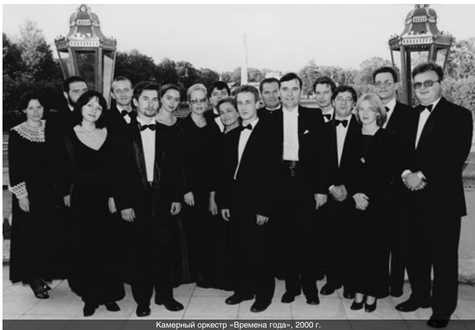
Камерный оркестр «Времена года», 2000 г.

– Мне кажется, что в музыке очень важно, какие темы композиторы затрагивают в своих произведениях. Как раз XX век показал, что темы были очень значи-