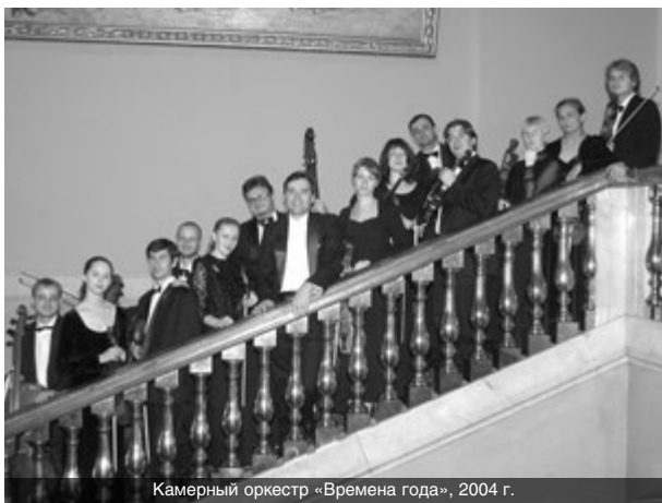
Камерный оркестр «Времена года», 2004 г.

– Есть другая катастрофическая ситуация – исчезновение камерной вокальной музыки со сцены. Ведь никто не поёт ни Шуберта, ни Шумана, ни Брамса, ни наших классиков, ни наших современников. Мне кажется, вообще сейчас мода на кричащих певцов. Они выдавали лирических