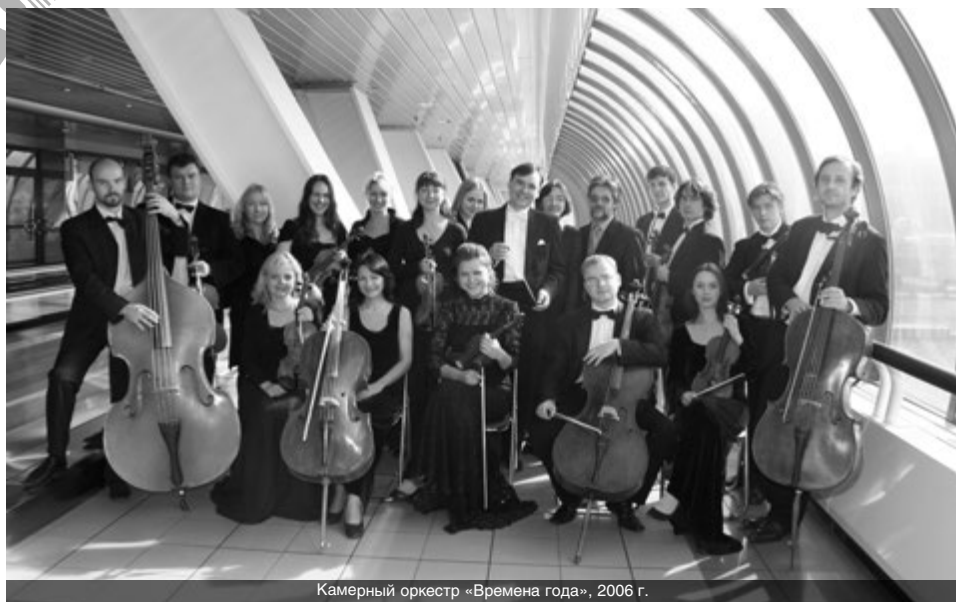
Камерный оркестр «Времена года», 2006 г.

фестиваль обычно проходит в сентябре – начале октября.