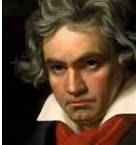
Л. ван Бетховен