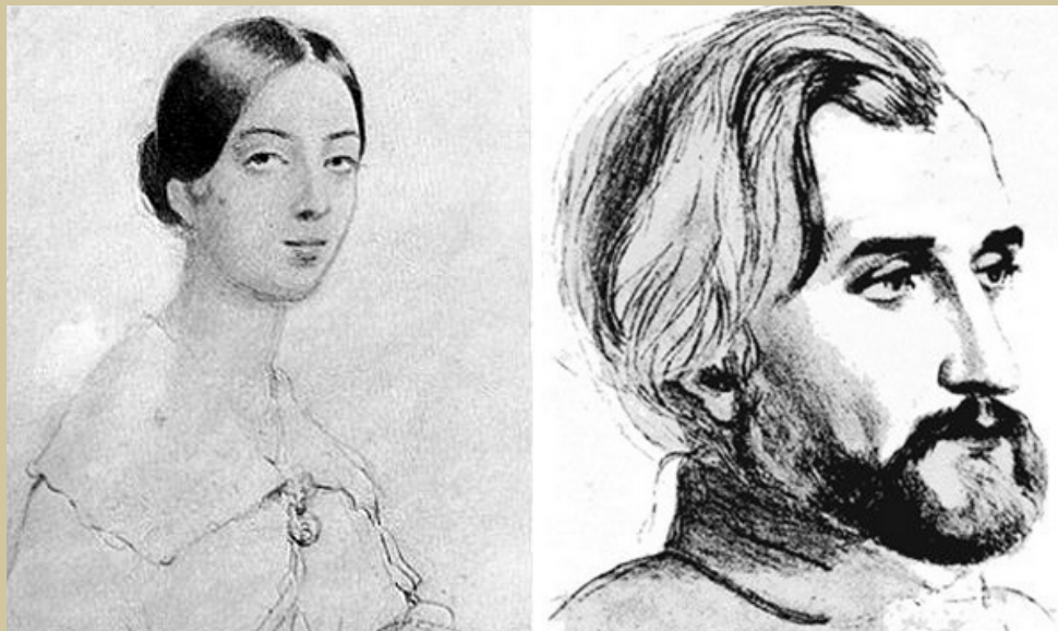
Автопортрет и портрет Тургенева

Важным элементом концепции всего спектакля стали рисунки самого писателя и Полины Виардо.